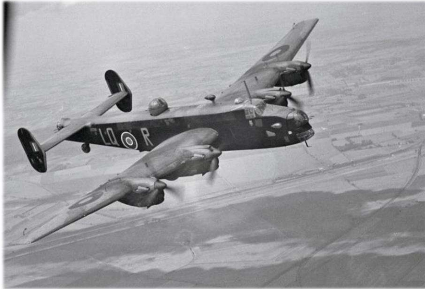
Bombardier Halifax LL129