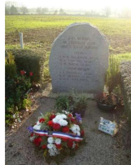
Stèle sur les lieux du crash