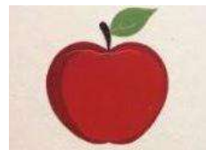
Le Verger de la Vallée