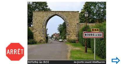
Arrêt à la Porte Saint-Mathurin

⇒ Chapelle Saint-Mathurin ↗ rue de la Libération ⇒ ancien château de Maridort ⇒ D55 ⇒ Groutel ⇒ CHAMPFLEUR ↗ ARÇONNAY ↗ D166bis